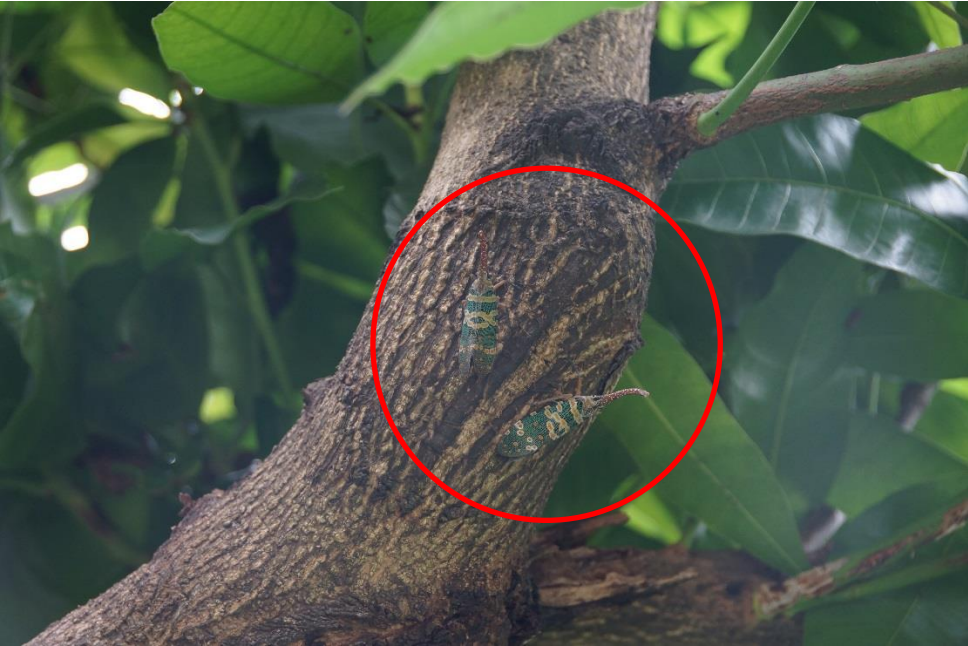
圖四、龍眼雞棲息於寄主植物粗壯枝條