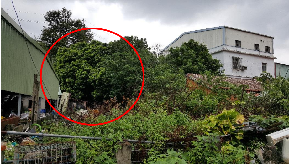
圖二、龍眼雞發現地點案例 1：民宅後院之龍眼樹，周圍有建築物遮蔽

發現龍眼雞時，請即時通報農委會防檢局(電話 02-33432064)，並提供發現地點之 GPS 定位位置及照片，俾利防檢局確認及規劃緊急防治作業。如欲捕捉龍眼雞，除使用捕蟲網、亦可使用夾鏈袋由蟲體斜後方視線死角緩慢接近，引蟲跳入袋內(圖六)。