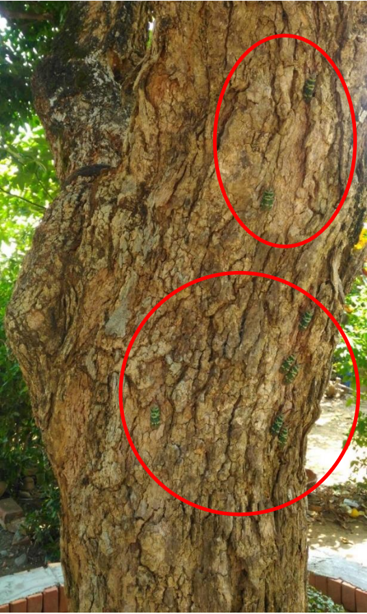
圖五、龍眼雞常群聚於寄主植物樹幹