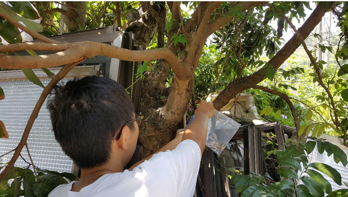
圖六、使用夾鏈袋自龍眼雞斜後方緩慢接近，引蟲跳入袋內