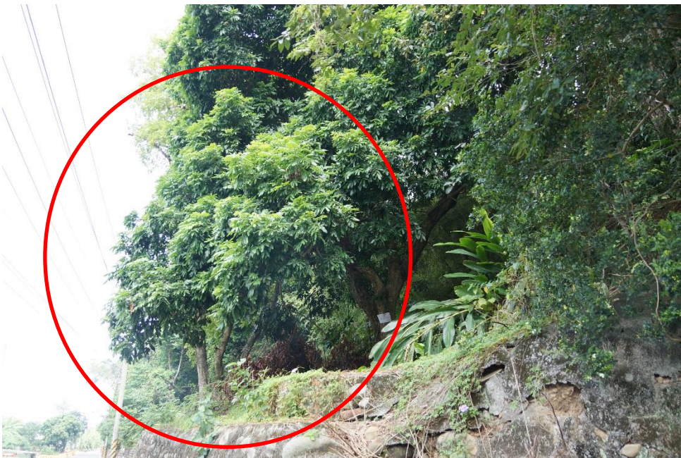
圖三、龍眼雞發現地點案例 2：坡地避風處之龍眼樹