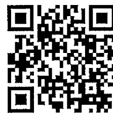
工作坊相關資訊 QR code

三、配合本比賽計畫將於 108 年 12 月間辦理「性教育微電影教材與教學設計工作坊」，歡迎全國有興趣之教師參加。（相關資訊請上 https://s.yam.com/kxU5D 查詢）