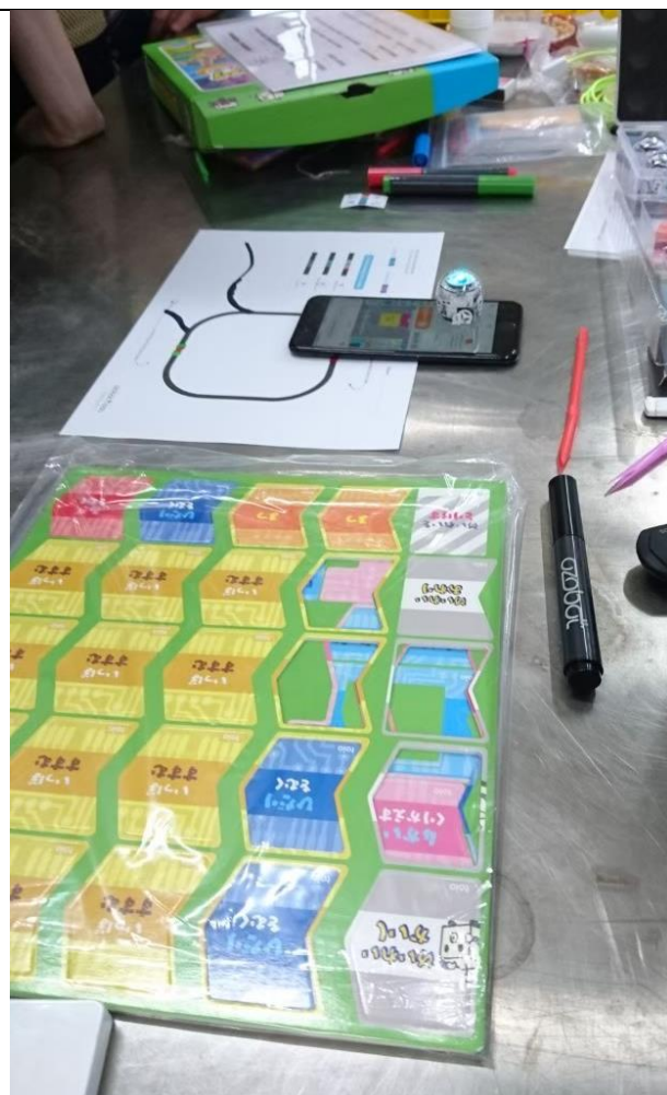
Sony toio 的配件任務卡