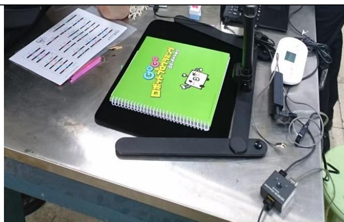
Sony toio 的配件任務小書