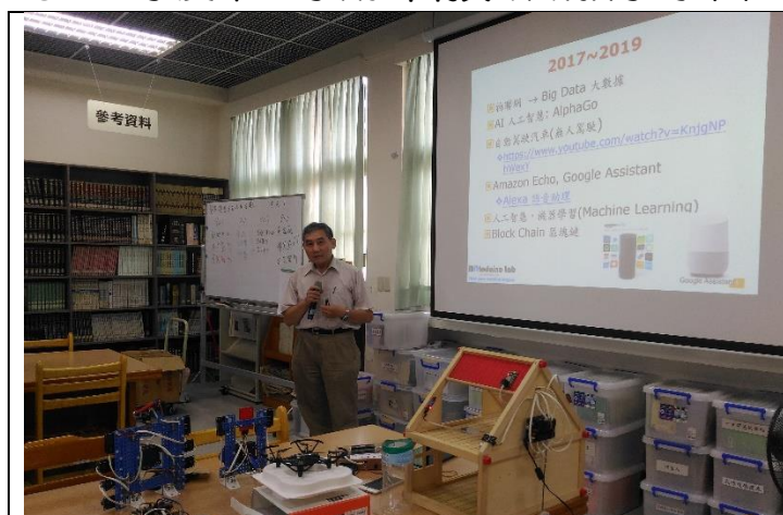
林協理介紹新興科技在教學上的應用