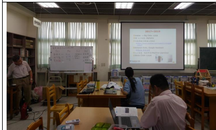
科技領域教師體驗試用