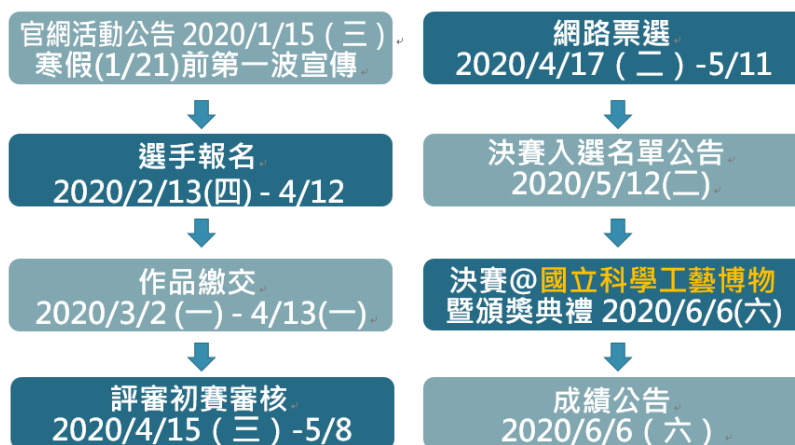
圖 2、2020 全國科學探究競賽競賽時程