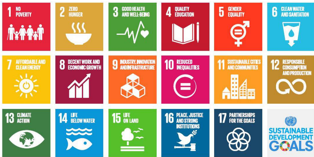
圖一：17項聯合國永續發展目標

二、相關學習任務分國小、國中、高中職三組進行，由教育局提供各學層之北北基國際教育學習地圖，並說明設計理念與教學上的運用。學生為達成地圖上之任務，藉由資料搜尋、同儕討論、自我省思、了解時事、實境走讀，手作體驗等方式，展現對全球議題的問題解決能力。