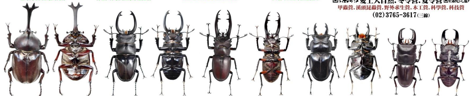
Allomyrina dichotoma ♂ 獨角仙 臺灣產最大型的兜蟲

愛上大自然, 冬令營, 夏令營 甲蟲營, 溪頭昆蟲營, 野外求生營, 木工營, 科學營, 科技營 (02) 3765-3617 (三線)