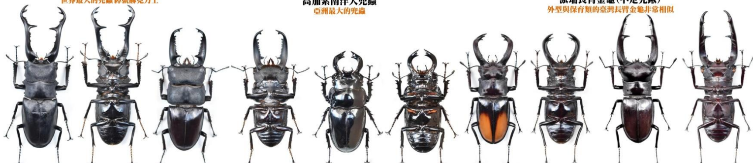
Prosopocoilus giraffa ♂ 長頸鹿鍬形蟲 世界最大的鍬形蟲