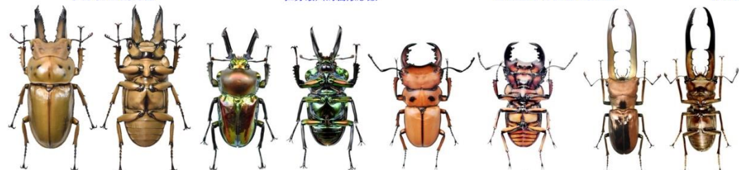
Allotopus moellenkampi ♂ 黃金鬼鍬形蟲 全身閃耀黃金般的光澤