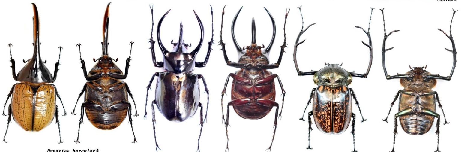
Dynastes hercules ♂ 長戟大兜蟲 世界最大的兜蟲 神羅赫力士