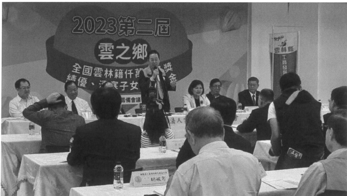
全國雲林籍千萬冠名獎助學基金於今年 2 月 19 日啟動募款，短時間就募得新台幣 912 萬元，嘉惠 304 名雲林子弟。

好施的雲林鄉親的聚力下『善行公益』，先後舉辦五屆全國「雲林金篆獎」書法比賽宏揚書藝文化，並彙編「第五屆雲林金篆獎書法比賽集」致贈母縣及各縣市政府學校、圖書館推廣書法國粹，也辦理六屆「勤樸獎」百萬清寒優秀子女獎助學金及 2014 第一屆「雲之鄉」冠名獎學金，還有育幼院愛心護幼濟助，連同本次捐助獎助學金累積挹注近伍仟萬元經費，回饋家鄉、嘉惠學子；此外，更辦理行銷二十鄉鎮市農漁特產展銷嘉年華會來幫助農漁民提高收益，就是希望能以實際行動幫助鄉親及學子。