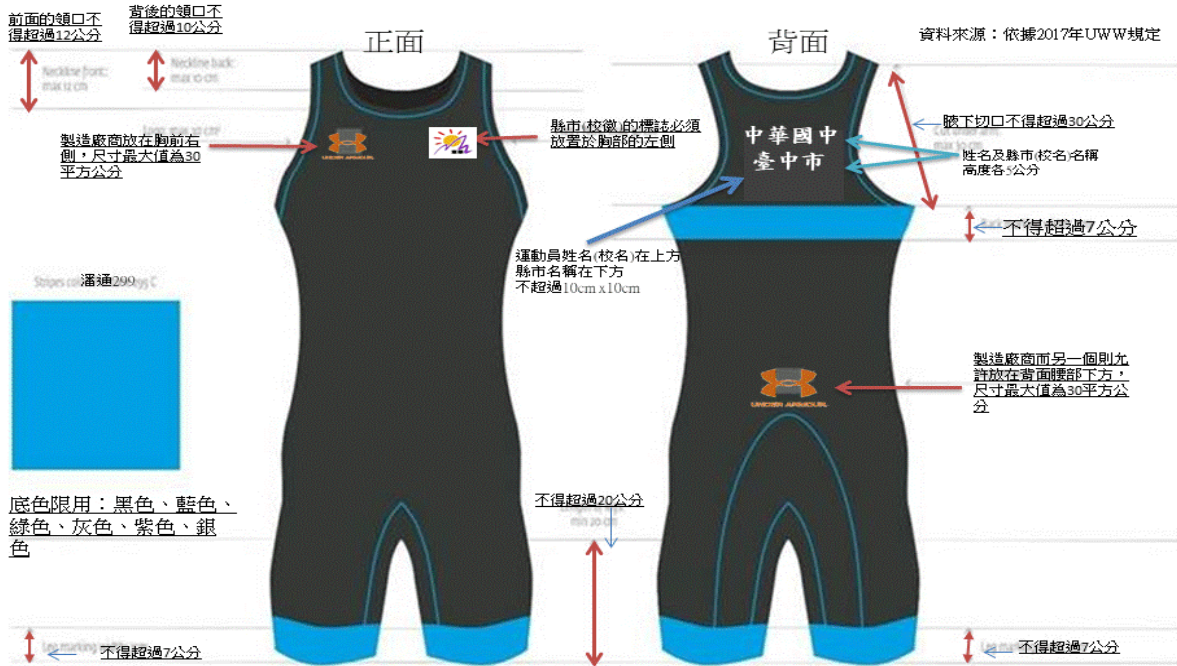
角力服腿的長度必須停止於膝蓋上方，並且不得短於膝上15公分